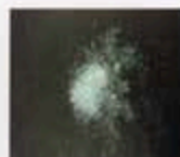
結晶化したプロキャップス 【左: 砕いた状態、右: 結晶化の状態】