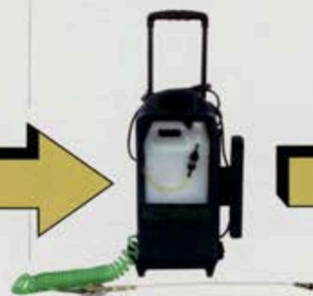
マルチスプレーヤー