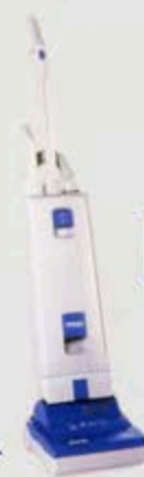
アップライト掃除機