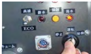
エコモードスイッチ

作業をしていない時はアイドリング状態になりエンジンの回転数を抑えます。作業を始めるとエンジンは即座に立ち上がります。作業をしていない時の燃費を抑えることで20%燃費向上(、当社製品比較にて)