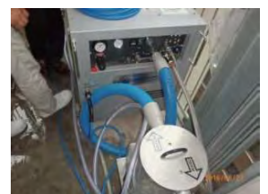
非常階段の脇に設置

操作性・搬入性を考慮したコンパクト設計。6人乗りのエレベーターにも載せる事ができ、高層マンションやビルの作業もホースを最小限にして作業する事が出来ます。