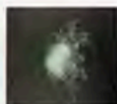
結晶化したプロキャップス 【左: 塗った状態、右: 結晶化した状態】