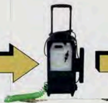
マルチスプレーヤー