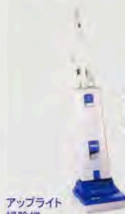
アップライト 掃除機